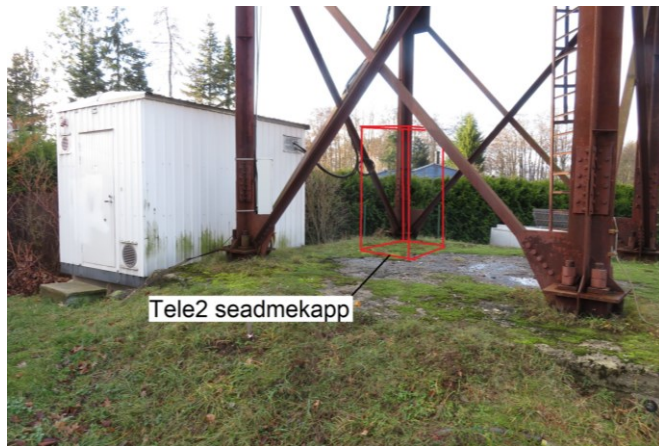
Joonis 2. Seadmekapi asukoht